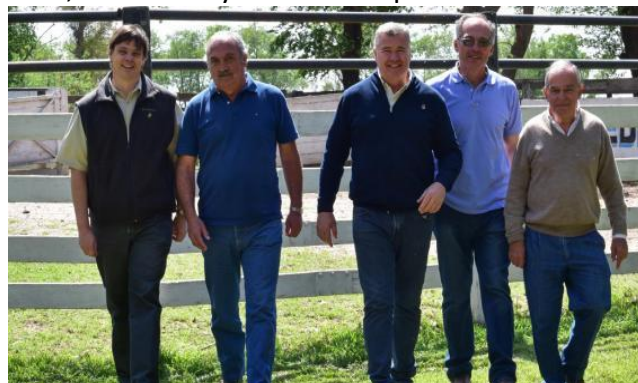
Productores tamberos CREA Villa María

miramos allá adelante, antes que cualquier otra cosa, buscamos y vemos las oportunidades.