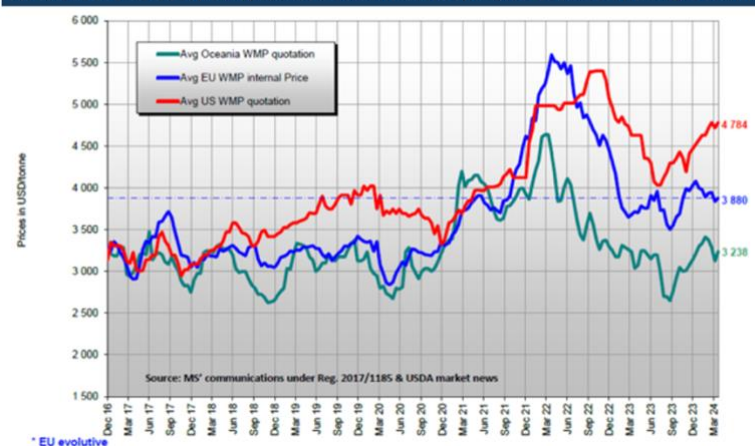
LECHE EN POLVO ENTERA: precios de la Unión Europea, los Estados Unidos y Oceanía

Desde una perspectiva política, el sector lácteo de la UE sigue teniendo preocupaciones relacionadas con la implementación de la nueva Política Agrícola Común (PAC) y las iniciativas del Pacto Verde de la UE, lo que pesa negativamente en las decisiones de los productores de continuar en la actividad. Fortalecer las políticas ambientales y de mitigación climática de la UE requeriría inversiones adicionales no productivas y erosionaría aún más la rentabilidad de la producción lechera. Sin embargo, debido en parte a las preocupaciones de los productores, las nuevas disposiciones se están diluyendo o retrasando su implementación. Se prevé que en 2024 se debilitará el impacto de la guerra en Ucrania sobre los costes de producción. Sin embargo, la UE continúa apoyando a Ucrania, con el acceso libre de aranceles y cuotas para los productos agrícolas ucranianos al mercado de la UE extendido hasta el 5 de junio de 2025, pero esto no está teniendo un impacto significativo en el sector lácteo de la UE.